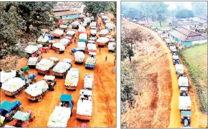
उपाजर्जन केंद्र के सामने धान लोड वाहन।

हरिभूमि न्यूज ▶▶ रामानुजगंज सरना उपाजर्जन केंद्र में 103 किसानों का टोकन काटा गया। किसानों की भारी भीड़ के कारण कई स्थानों पर व्यवस्था बनाए रखने में प्रशासन को कठिनाई का सामना करना पड़ा, हालांकि समितियों एवं प्रशासनिक अमले द्वारा लगातार प्रयास किए जाते रहे ताकि खरीदी प्रक्रिया सुचारू रूप से जारी रहे।