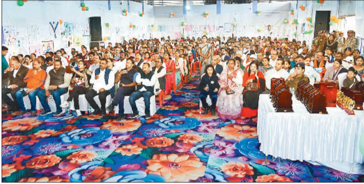
कार्यक्रम में उपस्थित लोग।